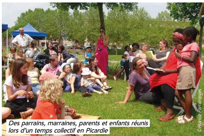
Des parrains, marraines, parents et enfants réunis lors d'un temps collectif en Picardie

L'association organise des sorties, des fêtes, des activités culturelles, sportives ou créatives, qui réunissent adultes et enfants dans une ambiance conviviale pour renforcer les liens entre parents, parrains, filleuls et bénévoles.